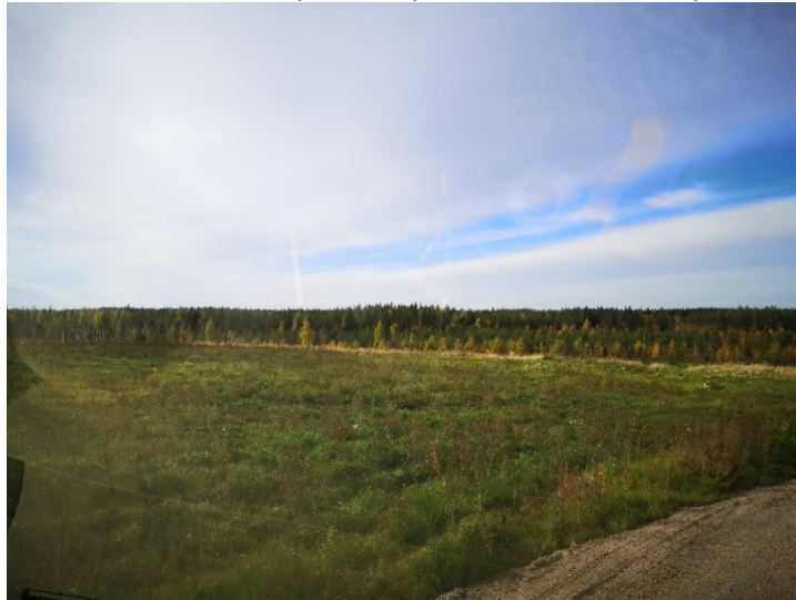
Kuva 3. Rikastushiekka-aluetta.

Alueille johtavat tiet on suljettu lukituilla puomeilla (5 kpl). Rikastushiekka-alueet ovat yleisen turvallisuuden edellyttämässä kunnossa. Rikastushiekka-alueella ei saa kasvaa puustoa pintarakenteiden säilyttämiseksi.