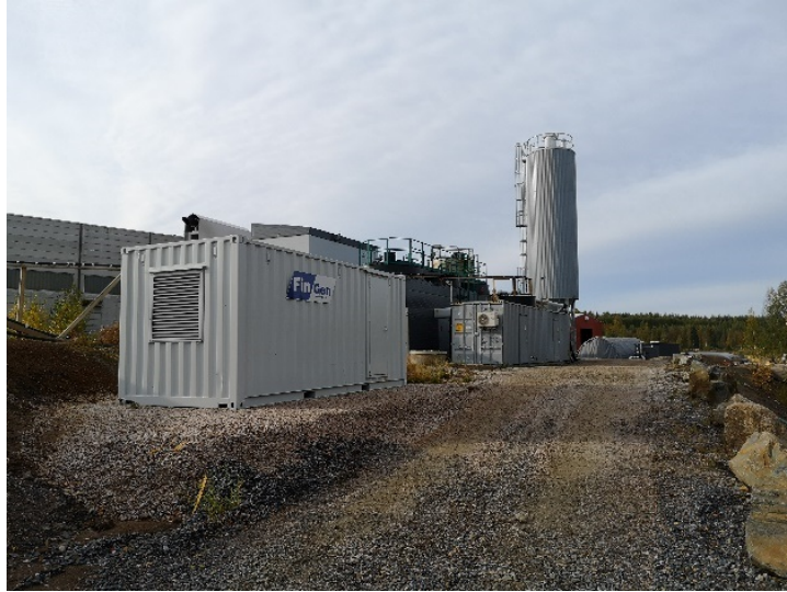
Kuva 4. Vesienkäsittelylaitos.