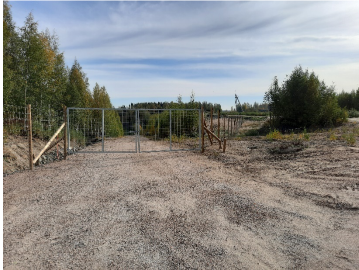
Kuva 2. Avolouhoksen ympärillä olevaa aitaa ja portti.

Avolouhos on yleisen turvallisuuden edellyttämässä kunnossa. Sortumavaarasta johtuen aidatun alueen sisäpuolelle meneminen on kielletty.