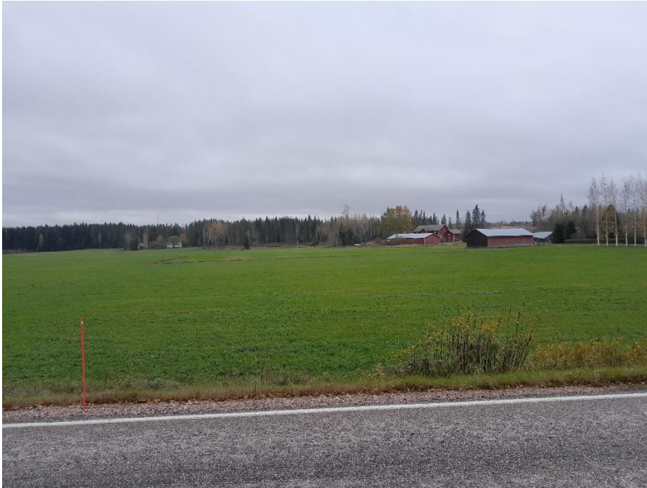
Kuva 6. K3 lounaaseen päin, paneelit jäävät metsän taakse.