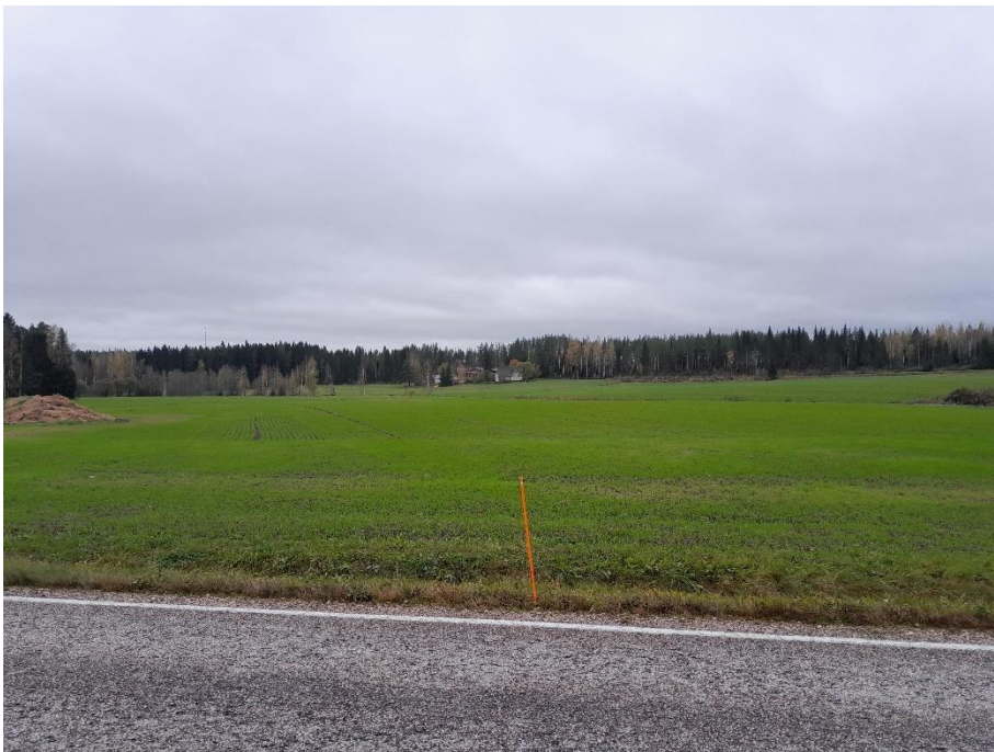
Kuva 3. K2 länteen päin, paneelit jäävät metsän ja kukkulan taakse.