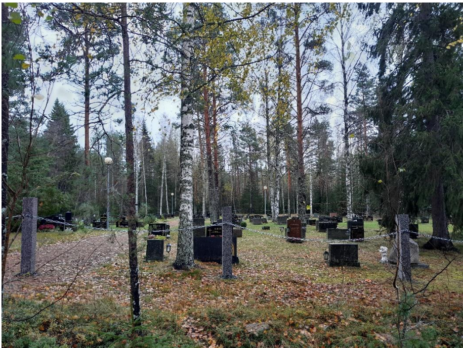
Kuva 17. K12 itään päin, paneelit jäävät metsän ja kukkulan taakse.