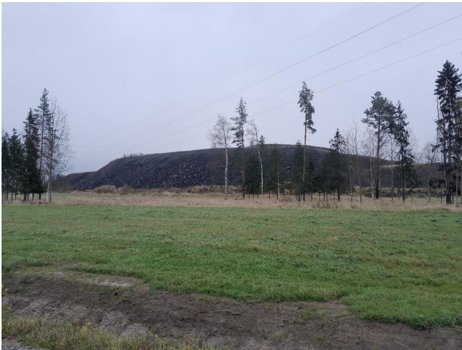
Kuva 11. K7 itään päin, paneelit jäävät maa-aineskasan taakse.