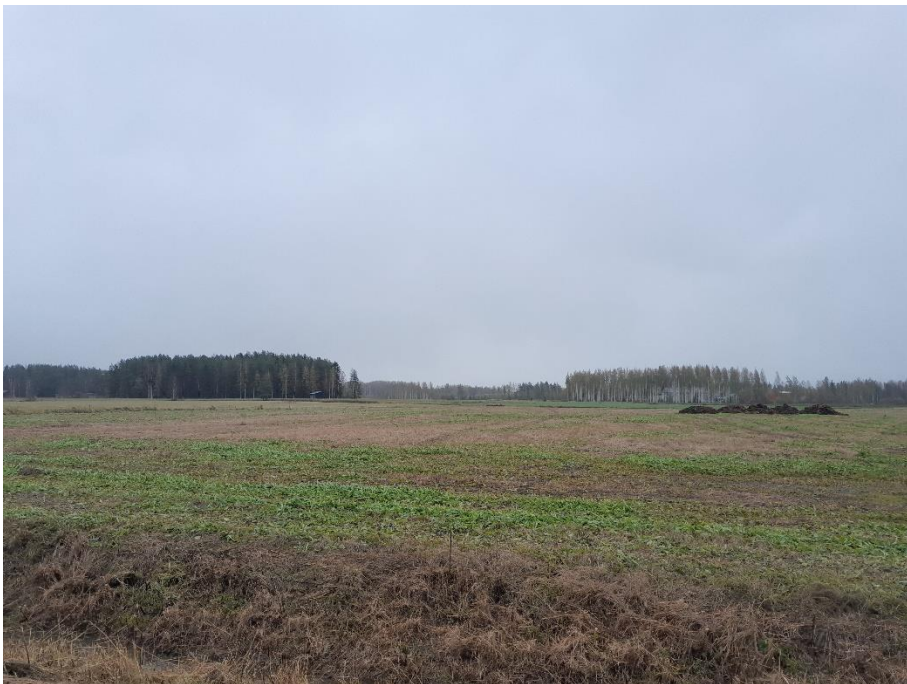
Kuva 15. K10 kaakkoon päin, paneelit jäävät metsän taakse.