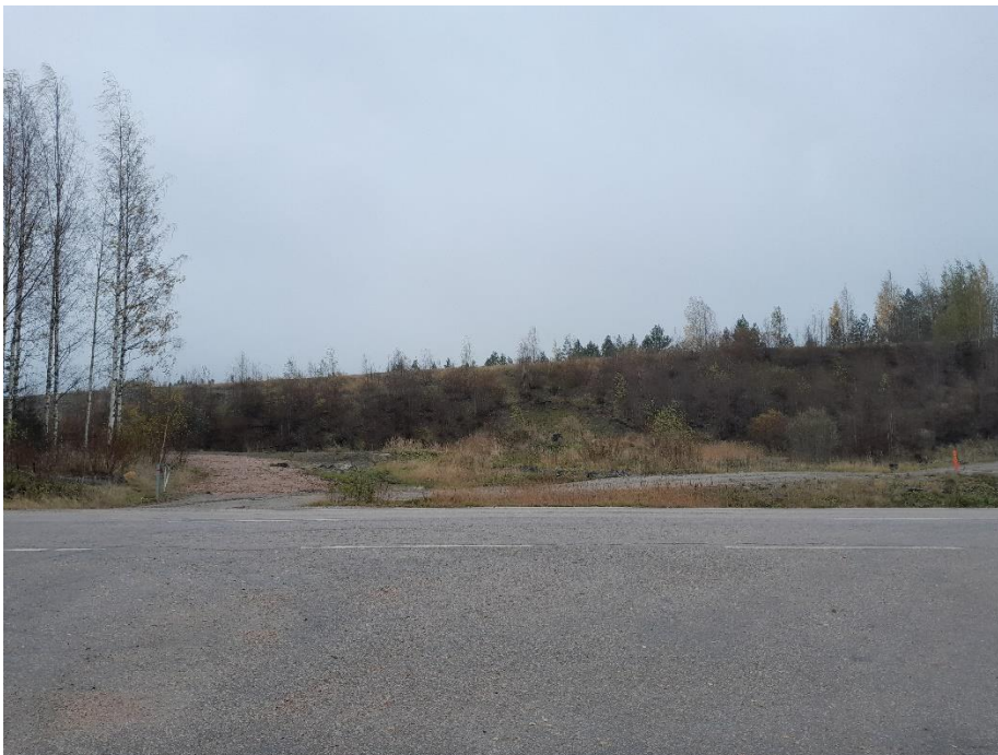
Kuva 13. K8 etelään päin, paneelit jäävät kukkulan taakse.