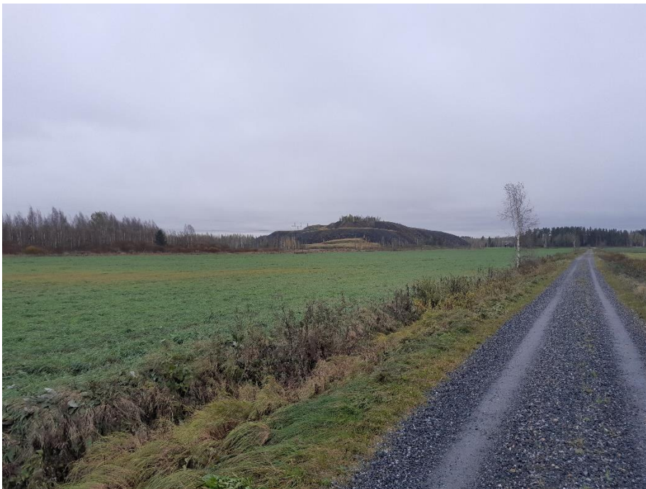
Kuva 9. K5 etelään päin, paneelit jäävät maa-ainekasan taakse.