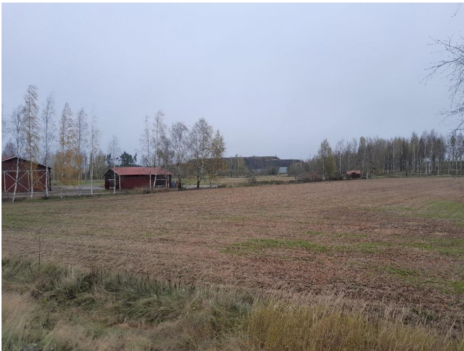
Kuva 5. K3 pohjoiseen, paneelit näkyvät hieman metsän takaa.