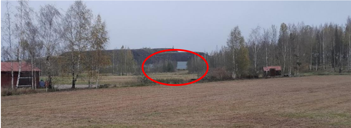
Kuva 19. Suurennos kuvasta K3 pohjoiseen.