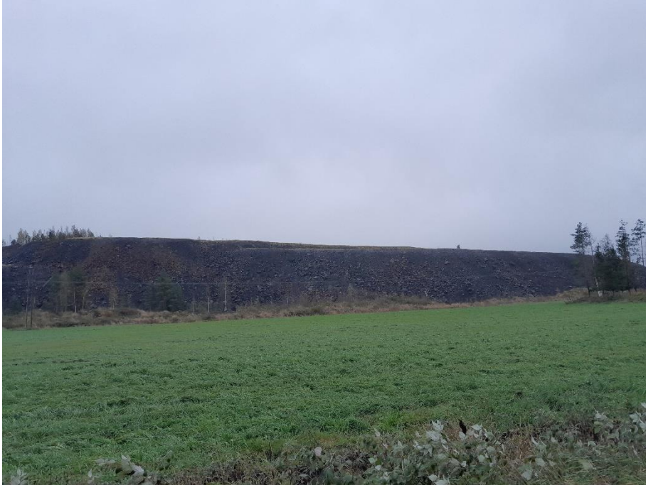
Kuva 10. K6 kaakkoon päin, paneelit jäävät maa-aineskasan taakse.