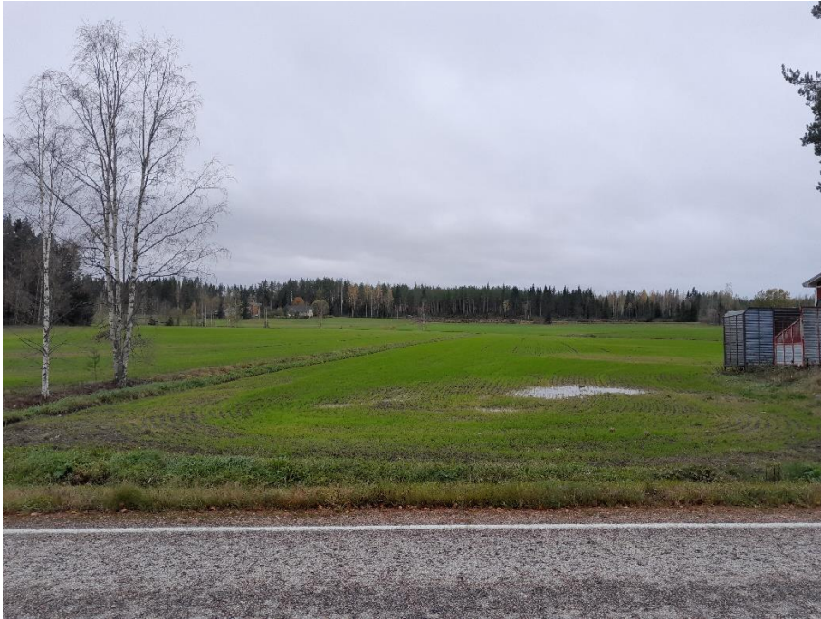
Kuva 2. K1 länteen päin, paneelit jäävät metsän ja kukkulan taakse.