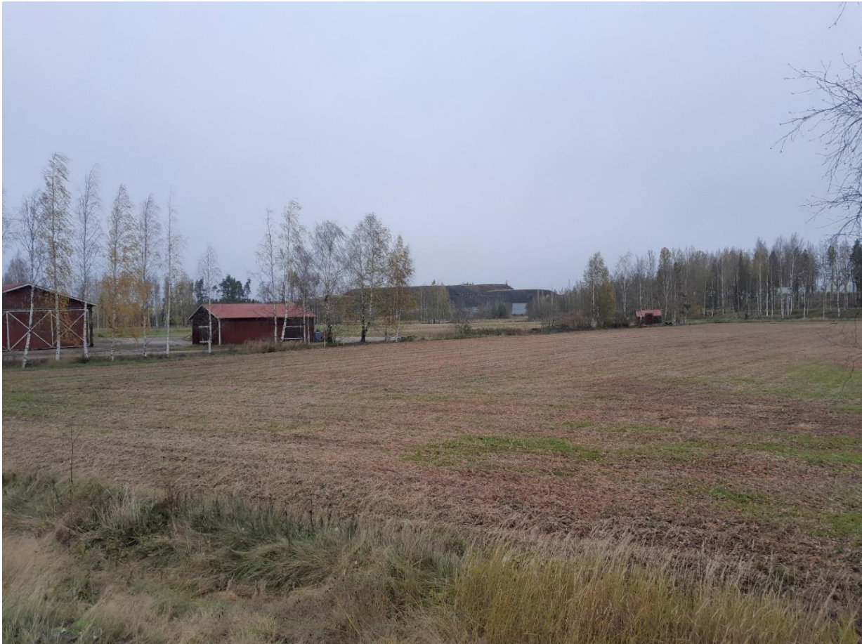
Kuva 18. K3 pohjoiseen.

Alueella suoritettun maastokäynnin ja havainnekuvien perusteella, kuvauskohdassa K3 pohjoiseen päin on ainoa kohta, jossa on mahdollisuus nähdä paneelit tieltä käsin. Muilla alueilla paneelit peittyvät suurimmaksi osaksi puiden ja kukkuloiden taakse, jotka ovat muodostuneet kaivostoiminnan aikana. Alla vielä esitettyinä ainoa kuva, jossa paneeleita on nähtävissä tieltä käsin.