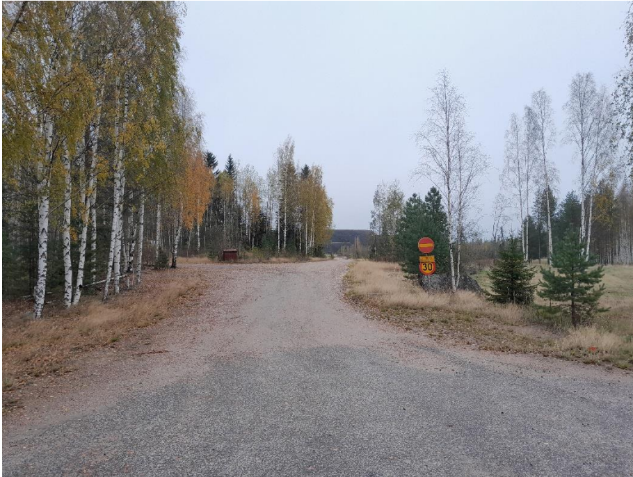
Kuva 8. K4 koilliseen päin, paneelit jäävät metsän taakse.