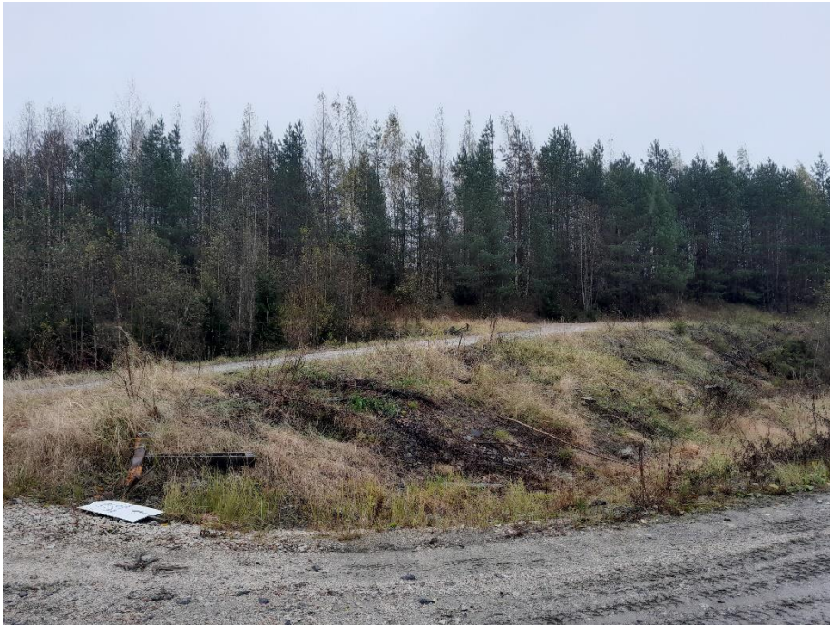
Kuva 16. K11 itään päin, paneelit jäävät metsän ja kukkulan taakse.