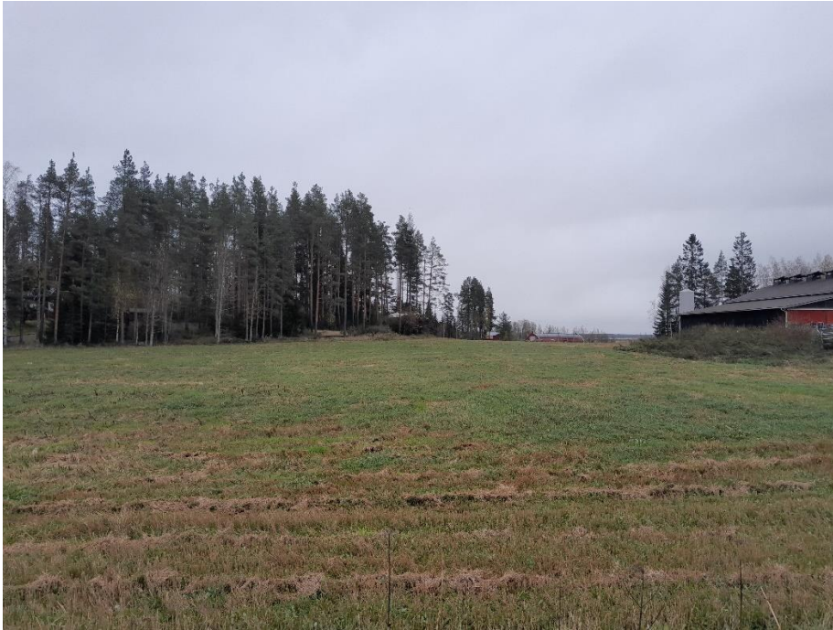
Kuva 4. K2 itään päin, paneelit jäävät metsän ja kukkulan taakse.