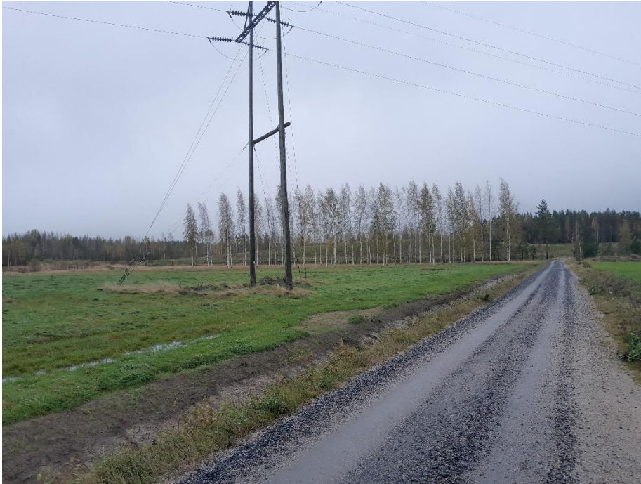
Kuva 12. K7 kaakkoon päin, paneelit jäävät kukkulan taakse.