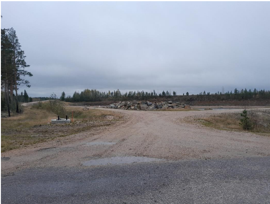
Kuva 7. K4 etelään päin, paneelit jäävät kukkulan taakse.