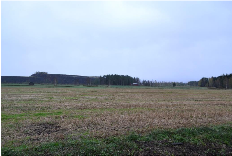
Kuva 14. K9 kaakkoon päin, paneelit jäävät maa-ainekasan taakse.