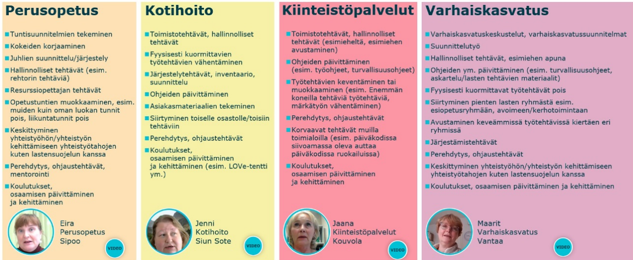
Kuvio 2: Korvaavan/mukautetun työn esimerkkejä eri toimialoilla (Keva)