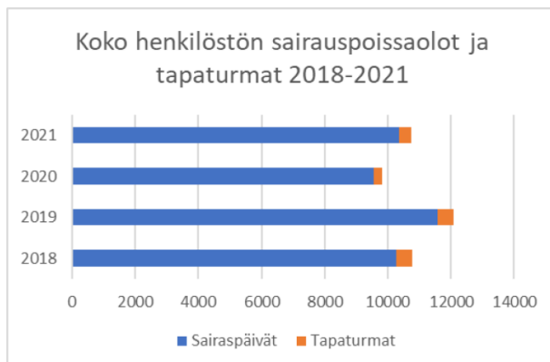
Kuvio11. Koko henkilöstön sairauspoissaolot ja tapaturmat.

Vuonna 2021 kaupungin henkilöstölle kertyi omista sairauspoissaolopäivistä sairauksien vuoksi 10 353 kalenteripäivää (2020:9 544) ja työtaturman/ammattitaudin vuoksi 382 (2020: 281) kalenteripäivää.