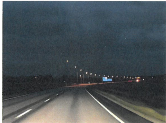
VT27 Makkaratien risteysalueella oleva valaistus Haapajärven suuntaan mentäessä