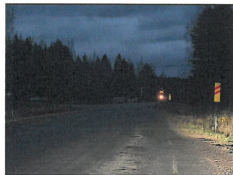
Kuva VT27 suunnalta tullessa

Yllä olevissa kuvissa Makkaratien ja Piimätien risteysalue, jonka viereen jää myös Karvoskylän koulu. Ei arvaisi koulun sijaitsevan aivan vieressä. Ei valaistusta, ei merkkiä koulun läheisyydestä, ei suoja-tietä