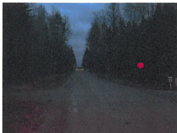
Kuva Piimätieltä koulun suuntaan, tämän tien varteen jää ne ainoat 2 merkkiä, jotka ilmoittavat koulun sijaitsevan lähellä. Tien päässä näkyy koulun piha-alueelta loistavat valot.

Lapset kulkevat kouluun kapeaa tien piennarta pitkin, tälläkin tiellä raskasta kalustoa kulkee aika paljon.