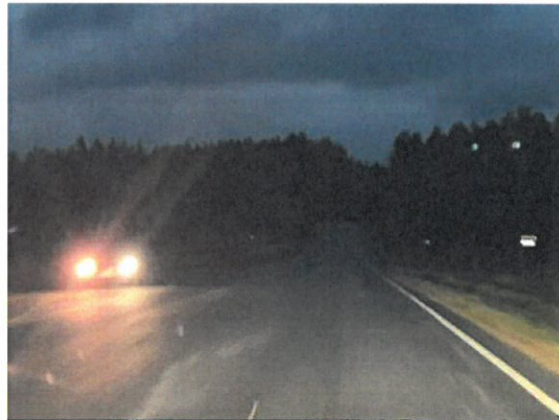
Edelleen kuvaa Makkaratieltä. Kuvassa jyrkkä mäki, joka on jo päivän näöllä vaaranpaikka, kun näkyväisyys mäen päälle aukeaa vasta noustessa.

Lapset kulkevat kouluun kapeaa tien piennarta pitkin, tälläkin tiellä raskasta kalustoa kulkee aika paljon.