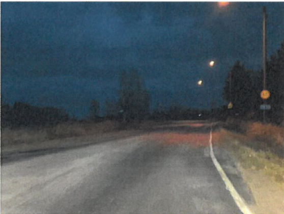
VT27 ja Makkaratien risteysalueen valaistusta makkaratien suuntaan kuvattuna