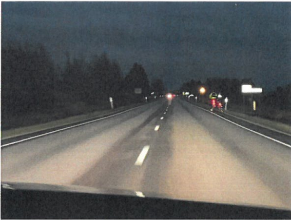
Kuva VT27 Nivalasta Haapajärven suuntaan Piimätien risteysalueen läheltä