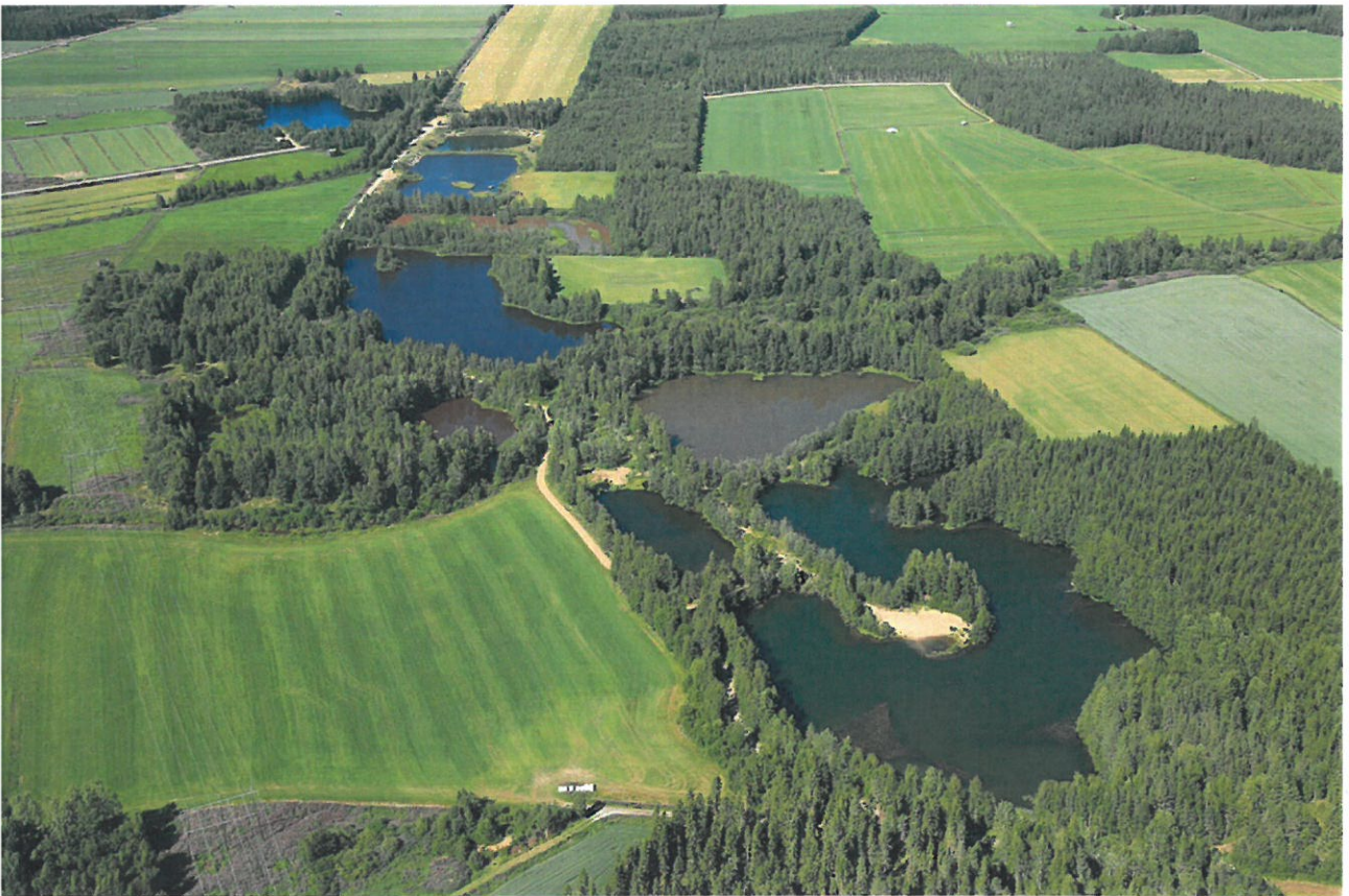
Kuva: Laukkupalon kosteikkoalue. (Ylivieskan kaupunki, ympäristöpalvelut/ Suomen Ilmakuva Oy).

Rakennus- ja ympäristölautakunta 15.3.2022