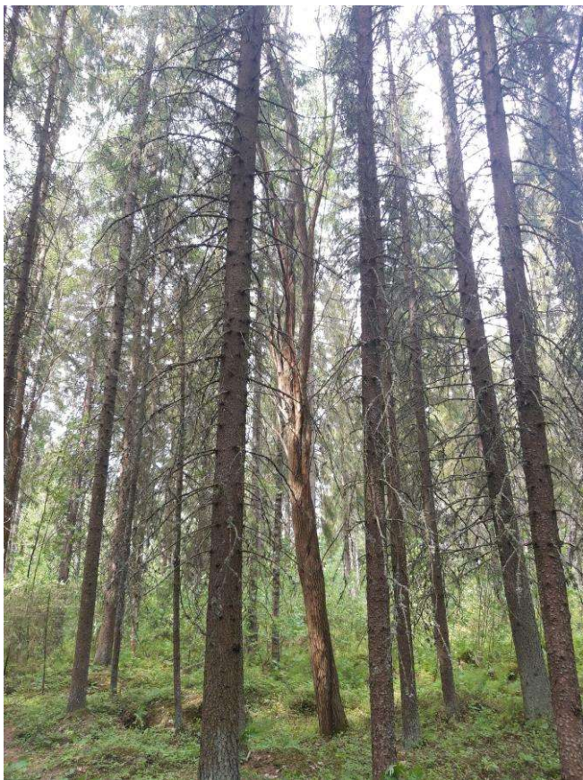
Kuva 5. Suunnittelualueen kuusimetsää sekä yksittäinen raita kuvan keskellä.