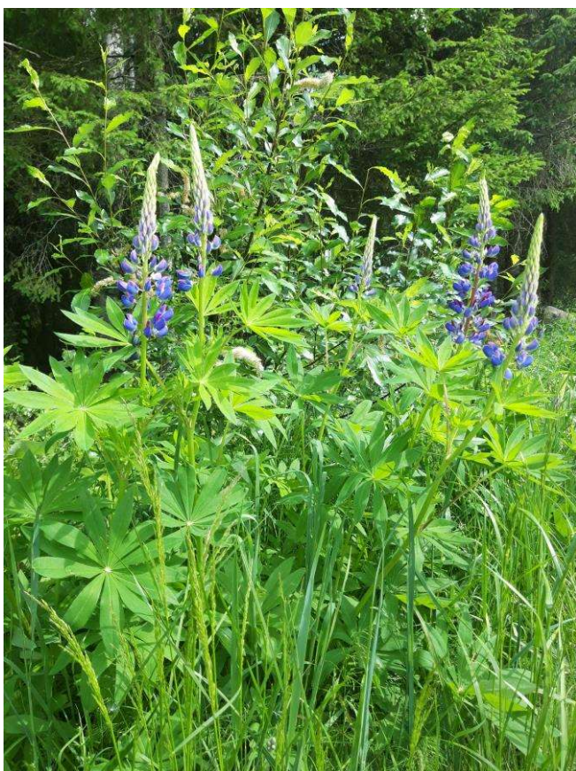
Kuva 6. Komealupiinia Vanhan Pirttirannan tien varressa.