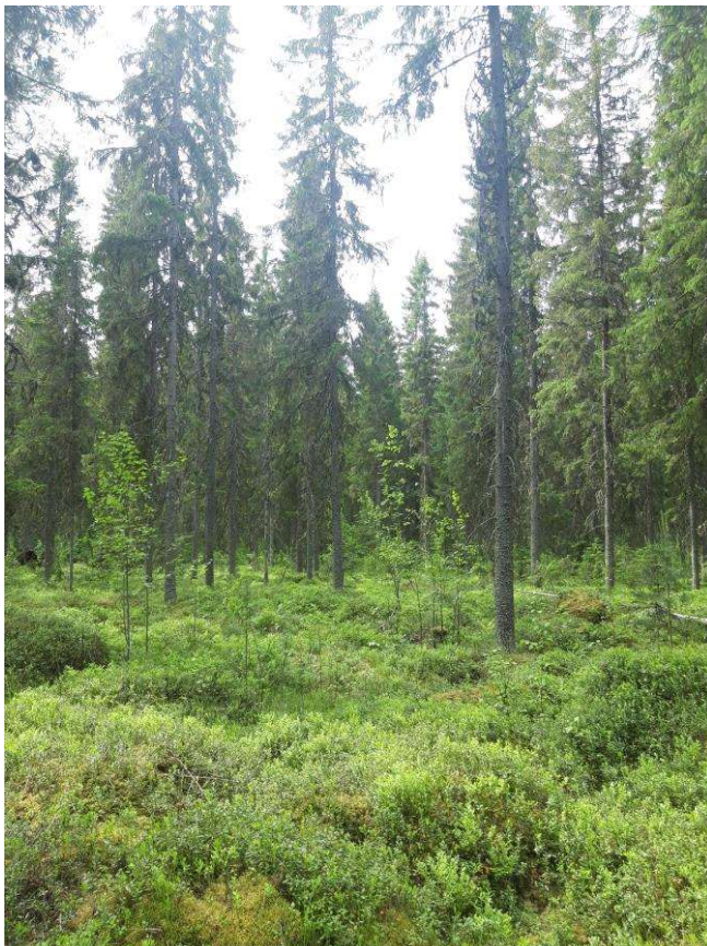
Kuva 4. Suunnittelualueella olevaa kuusimetsää, jossa on paikoin soistumaa.

Vanhan Pirttirannan tien sekä Pirttirannan tien varressa kasvaa tavanomaista piennarlanjistoa. Paikoin Vanhan Pirttirannan tien varrella kasvaa komealupiinia ( Lupinus polyphyllus ) (Kuva 6). Komealupiini on säädetty kansallisesti haitalliseksi vieraslajiksi (Vna 704/2019).