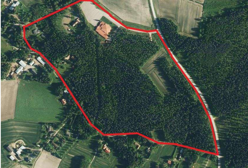
Kuva 2. Suunnittelualue on pitkälti rakentamatonta metsämaata.

Suunnittelualueella on voimassa yleiskaava (Kuva 3). Suurin osa suunnittelualueesta on yleiskaavassa varattu asuinrakentamiseen. Pirttirannantien varsi on varattu lähivirkistysalueeksi. Suunnittelualan pohjoisosa kuuluu valtakunnallisesti merkittävään Kalajokilaakson kulttuurimaisema-alueeseen, jossa pellot on säilytettävä avoimena ja rakennushistoriallisesti merkittävien rakennusten ja ympäristön säilyminen tulee turvata.